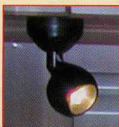
●ハロゲンスポットライト