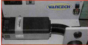
ドイツ・ベバストのヒーター